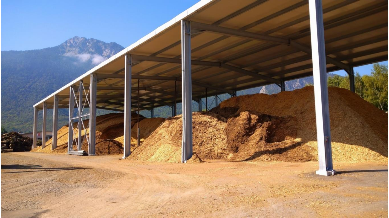
Emplacement plateforme et région d’approvisionnement